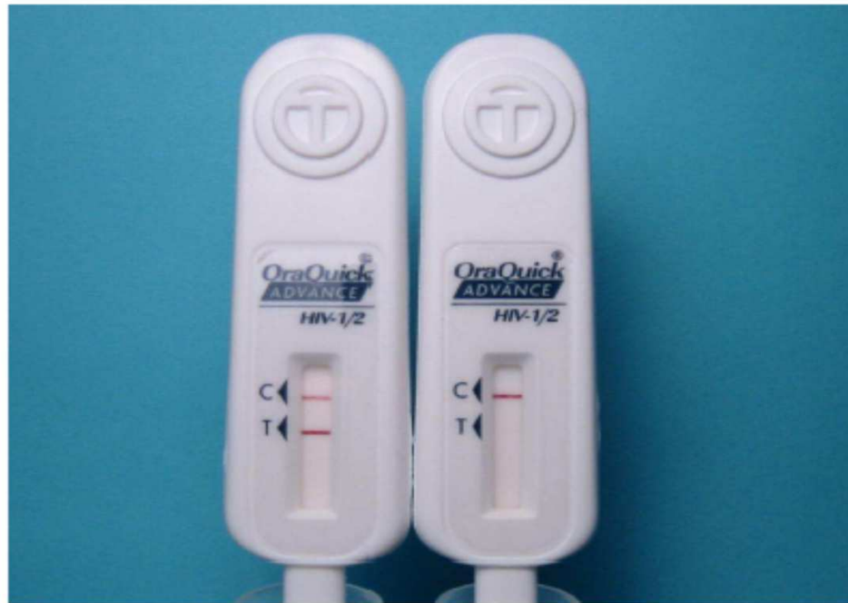
OraQuick ADVANCE Rapid HIV-1/2 Antibody Test